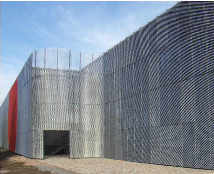
Näkymä idästä päin