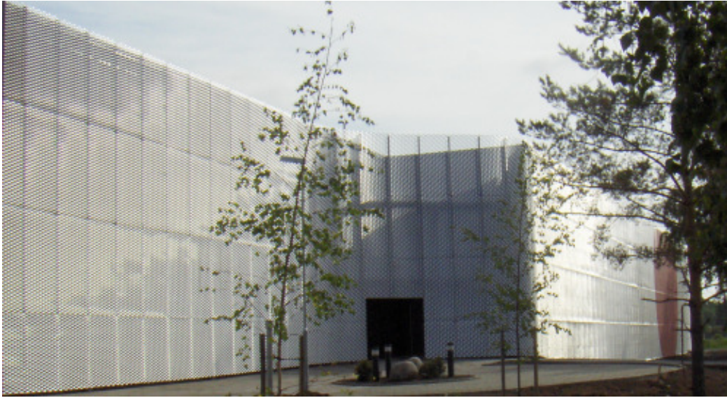
Näkymä lännessä päin