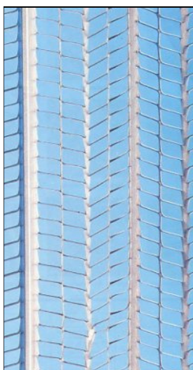
Muotti- työsaumaverkko NER-LAT Myyntiyksikkö 15 kpl:n pakkaus